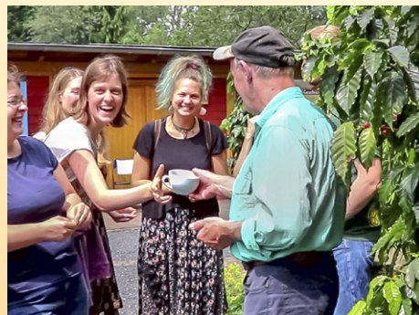
Sie untersuchen echte Kaffeekirschen.