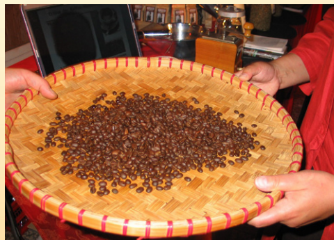
Die frisch gerösteten Bohnen ...