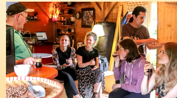
werden direkt verkostet.